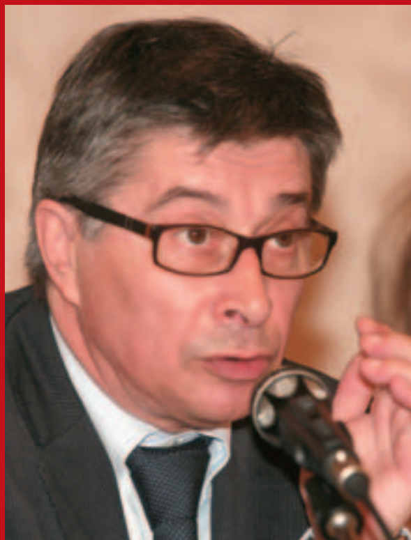
■ Il Presidente della Regione Emilia-Romagna Vasco Errani

strumento finanziario complementare rispetto a quelli nazionali, credo sinceramente che, grazie alle azioni che ho citato, potrà svolgere un ruolo determinante per aiutare le imprese e i lavoratori in questo momento di grande vulnerabilità, tanto nella vostra quanto nelle altre regioni d'Italia e d'Europa.