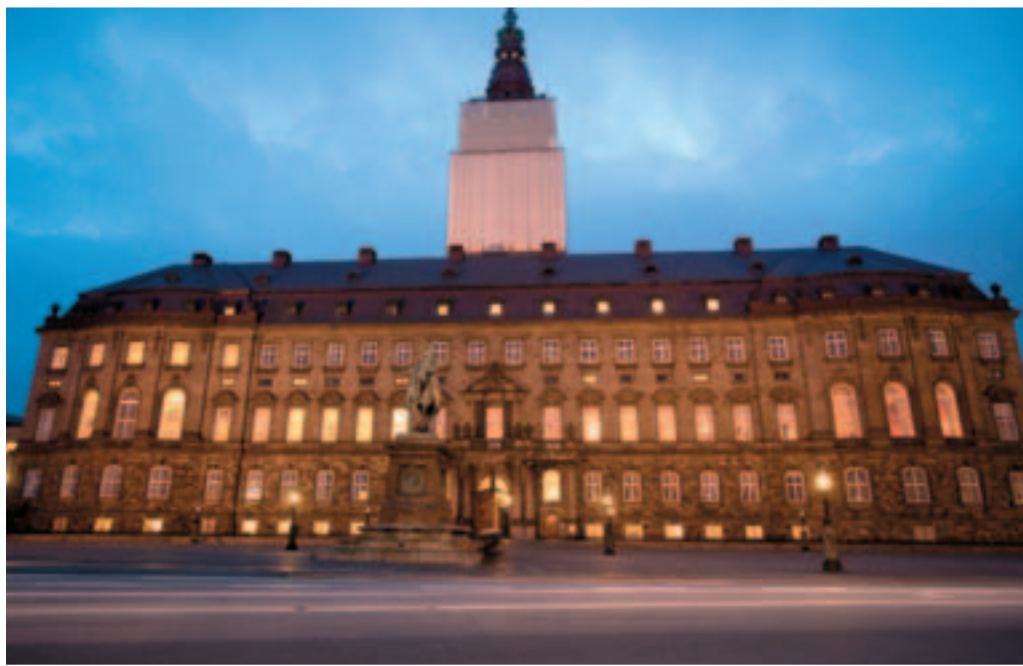
■ La sede del Parlamento danese

Europe for the climate conference in Copenhagen