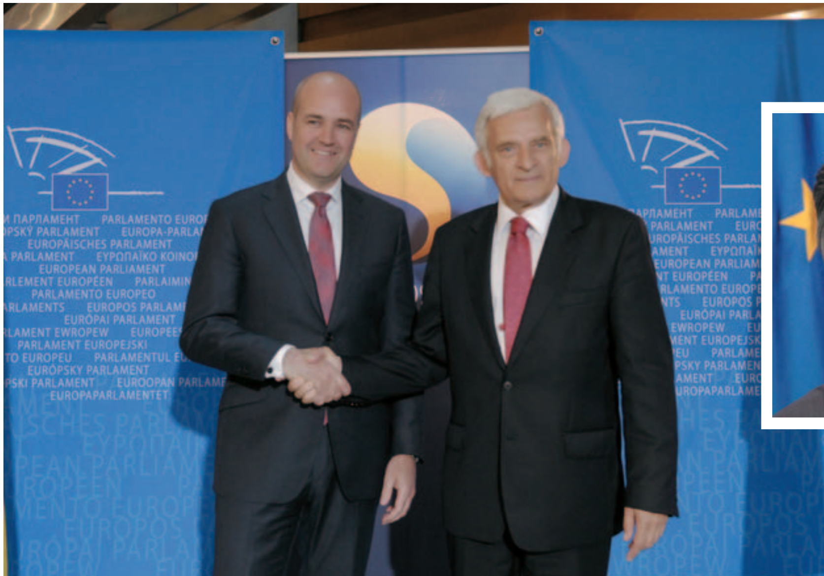
■ A sinistra il capo del governo della Svezia, che ha la presidenza di turno della Ue Fredrik Reinfeldt insieme al nuovo presidente del parlamento europeo Jerzy Buzek. Sotto: Jose Manuel Barroso

the irish referendum, fear leads to a barroso 2/the 27 member european union is compact on the hypothesis of a barroso 2