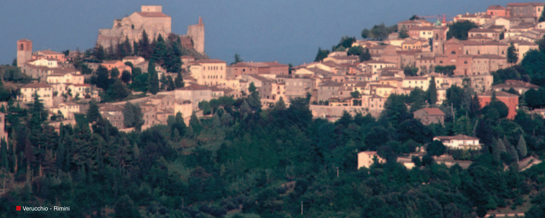
■ Verucchio - Rimini

il progetto fa parte del programma central europe. coinvolta la provincia di rimini come coordinatore