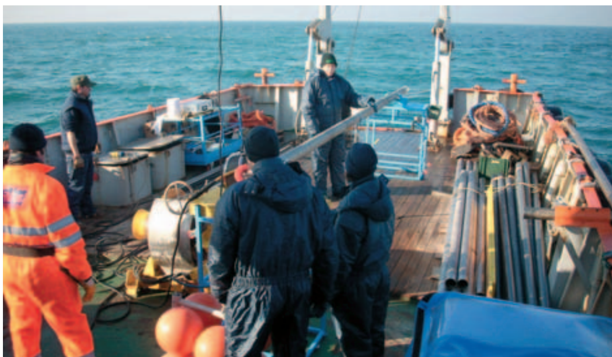
■ un momento delle ricerche di Beachmed-e

In Emilia-Romagna partecipano ai sottoprogetti Arpa (Agenzia Regionale Prevenzione e Ambiente), il Dipartimento di Scienze della Terra dell'Università di Ferrara, il Cirsa, il Distart, il Dse e il Distat dell'Università di Bologna (in totale sono 40 i partner di tutte le 9 Regioni partecipanti). Come osservatore figura anche il Parco del Delta del Po. Il budget complessivo dell'Operazione Beachmed-e è stato di 7,6 milioni di euro: l'Emilia-Romagna ha avuto una disponibilità di poco più di 900mila euro (il 50% provenienti dalla Ue, il 35% dal Ministero delle