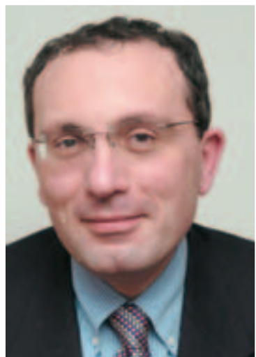
■ Stefano Manservisi

Le porte aperte dell'Unione europea e i programmi concreti di cooperazione e di aiuto regionale stanno accompagnando i Balcani verso la pacificazione e la stabilità democratica. Croazia, Albania, Serbia, Bosnia-Erzegovina, Montenegro, Macedonia e Kosovo stanno procedendo sullo stesso cammino seppure con andature differenziate, che fanno prevedere tempi diversi di arrivo. "La meta è però la stessa per tutti", afferma in questa intervista Stefano Manservisi, già capo di gabinetto del commissario Ue Mario Monti e del presidente della Commissione europea Romano Prodi, oggi direttore