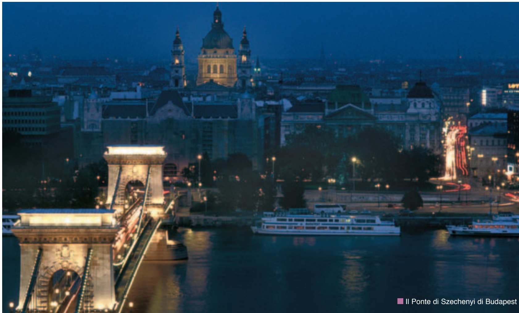
■ Il Ponte di Szechenyi di Budapest

transnational cooperation, the region to play a key role/emilia-romagna has been named italy's reference point on transnational cooperation